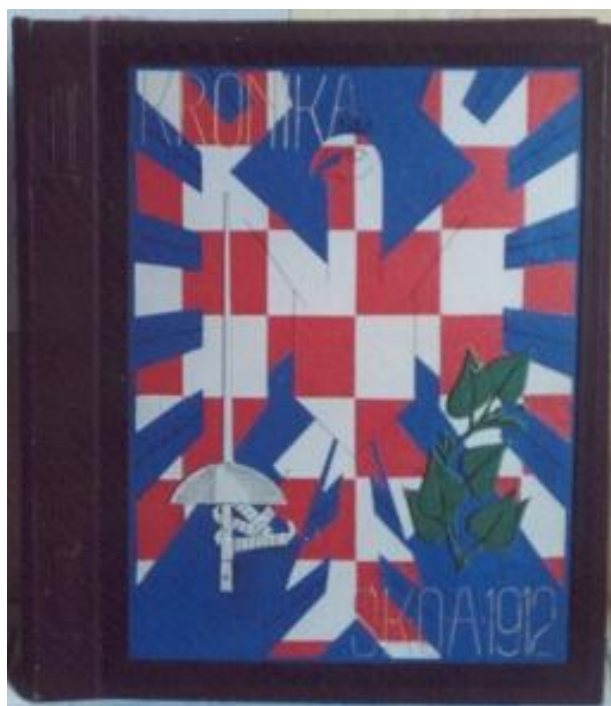
Kronika, která vznikla v roce 1940 a z níž autor čerpal většinu informací k sepsání dokumentu