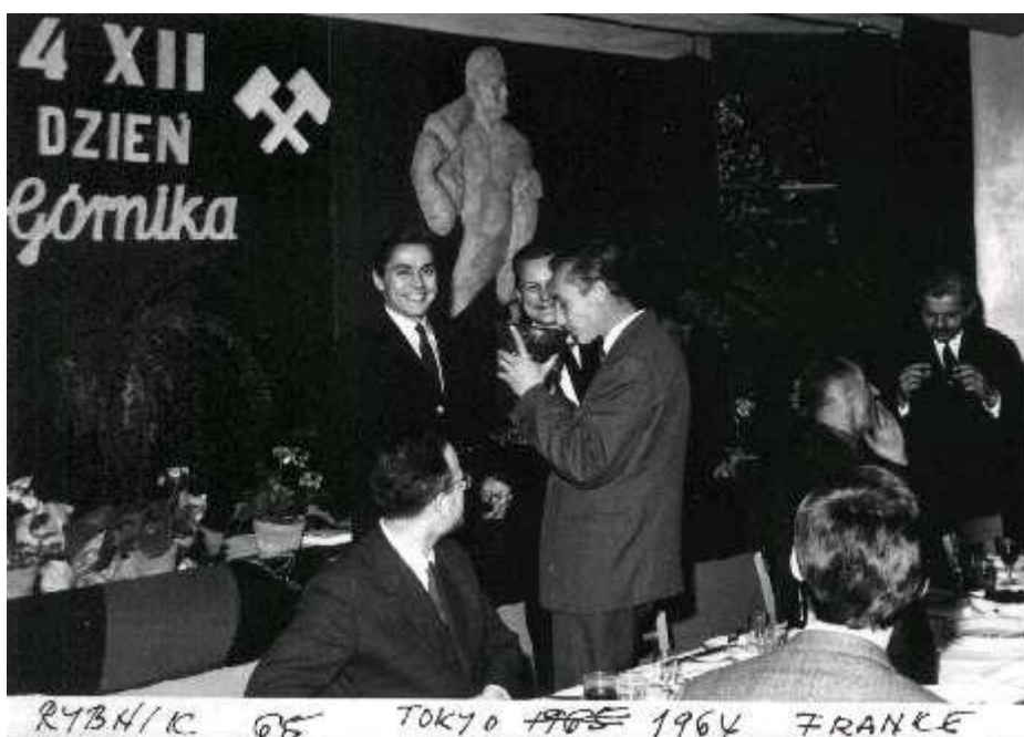
Při návštěvě v polském Rybniku v roce 1965. Na fotografii vlevo je olympijský vítěz v šermu fleretem mužů v Tokiu 1964 Egon Franke a Zdeněk Mynařík.